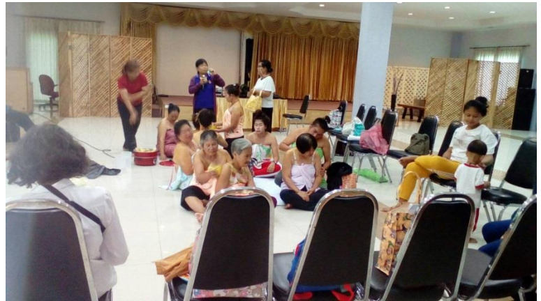
โครงการนัดเพื่อผ่อนคลาย