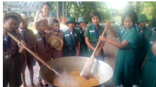
กวนกาลละแม