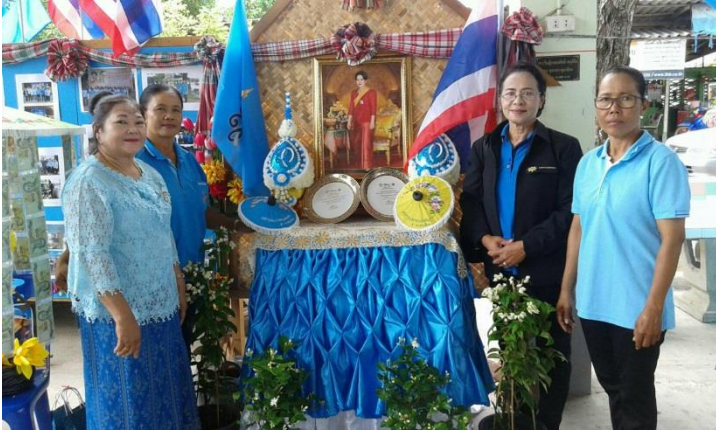
งานรวมพลคนกองทุนแม่