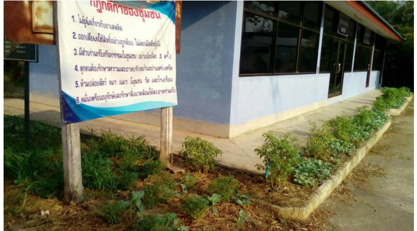
ปลูกผักปลอดสาร