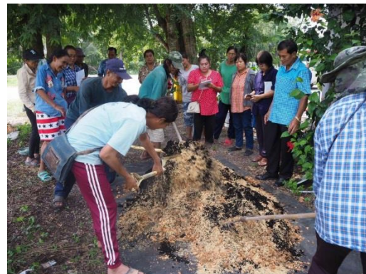
ทำปุ๋ยหมักชีวภาพ