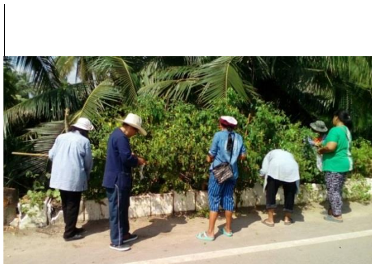
ปลูกผักปลอดสาร