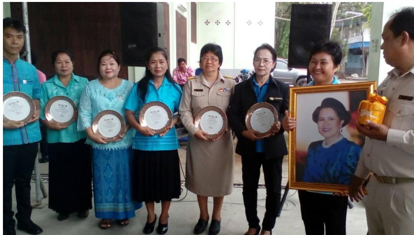
รับรางวัลกองทุนแม่ดีเด่นระดับอำเภอ