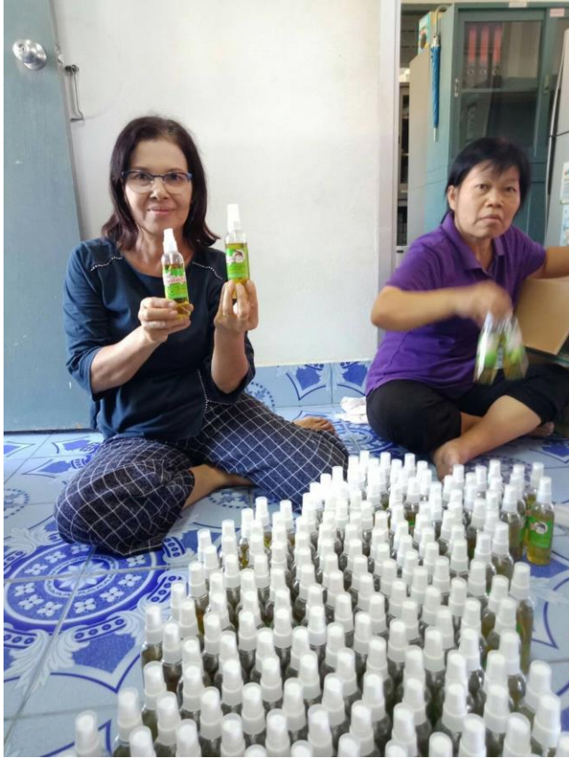
โลชั่นมะกรูดไฉ่ยุง