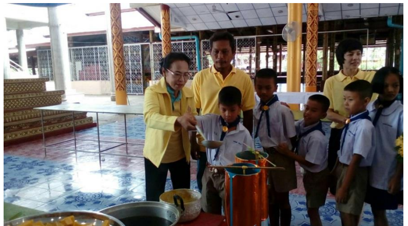
วันเข้าพรรษา