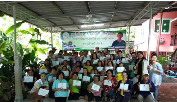
อบรมด้านเศรษฐกิจพอเพียง