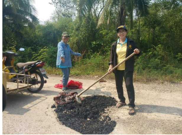
ถนนปลอดหลุม คนในชุมชนปลอดภัย