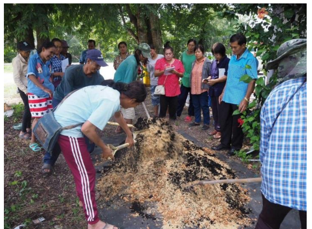
โครงการเตรียมความพร้อมเข้าสู่ผู้สูงวัยผ่านการมีส่วนร่วมของคนในหมู่ 6 ต.นางตะเคียน