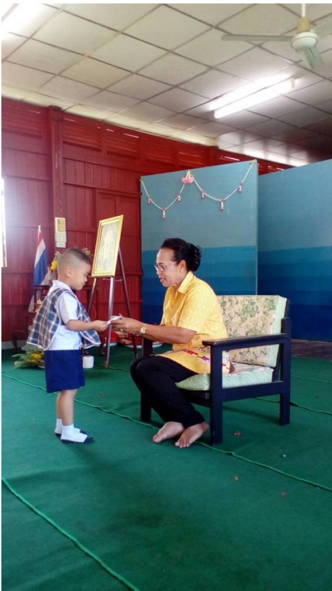
มอบทุนการศึกษา