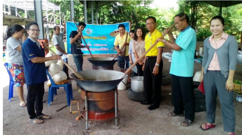
กวนกระยาสารท