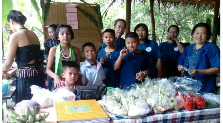
ไทยทรงดำ