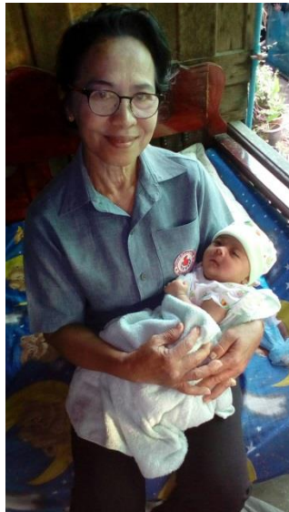
โครงการเยี่ยมเยียนดูแล