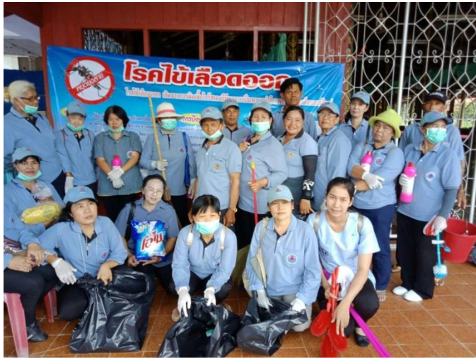
โครงการรณรงค์ป้องกันไข้เลือดออก