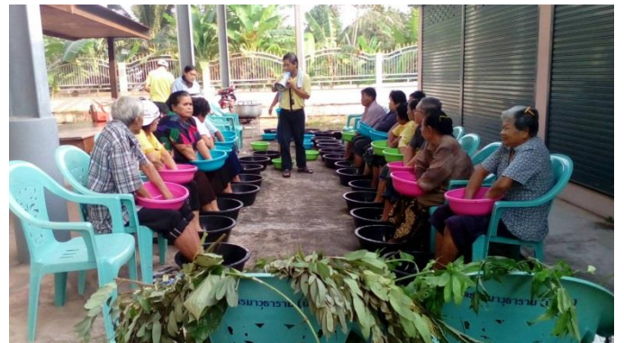
ผู้สูงอายุ