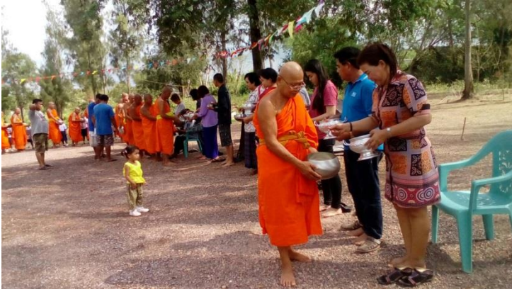
ปรีวาสกรรม