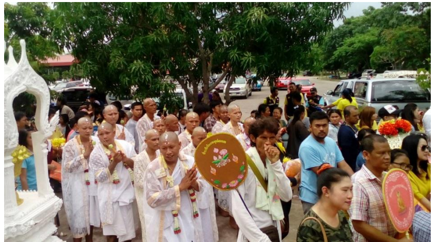
บวชนาคหมู่