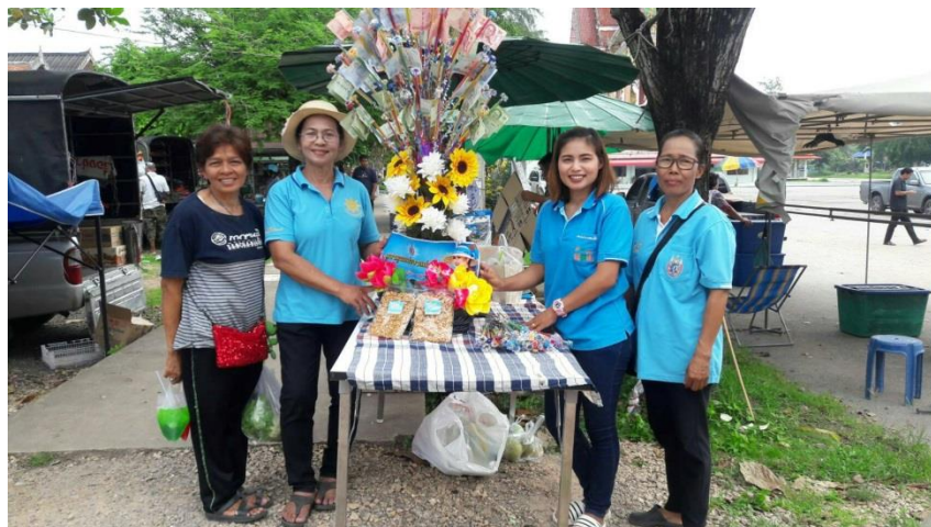
จำหน่ายกระยาสารทสร้างศรัทธากองทุนแม่ของแผ่นดิน