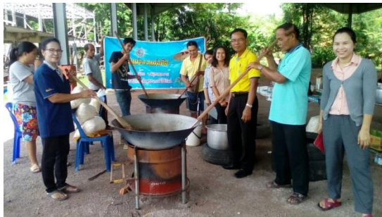
กวนกระจ่างสารท