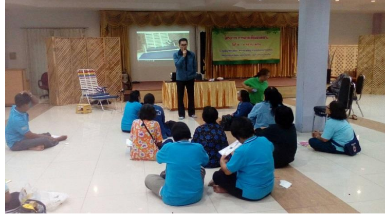
หมวดจุดบริเวณเท้า