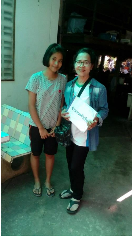
เก็บข้อมูล จปฐ.